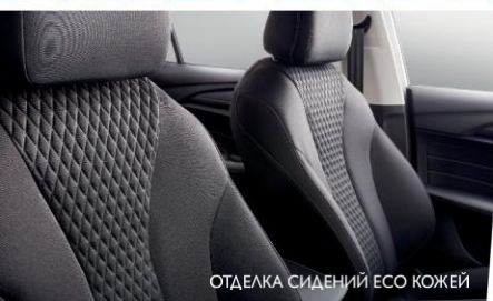
ОТДЕЛКА СИДЕНИЙ ЕСО КОЖЕЙ