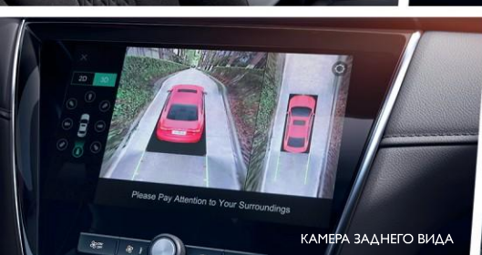
КАМЕРА ЗАДНЕГО ВИДА