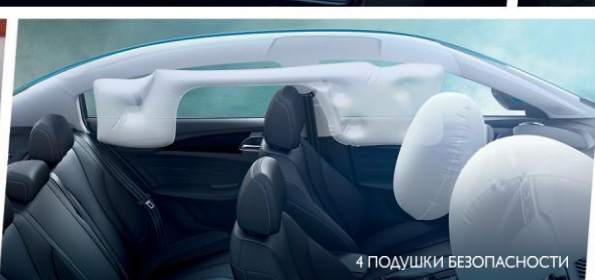
4 ПОДУШКИ БЕЗОПАСНОСТИ