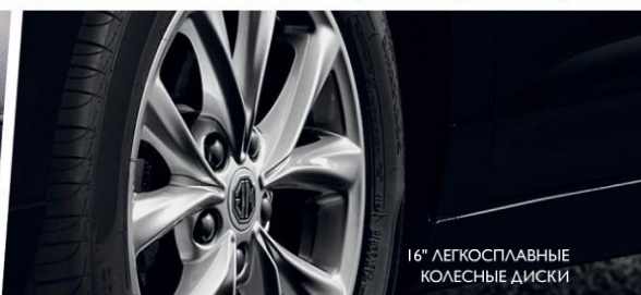
16" ЛЕГКОСПЛАВНЫЕ КОЛЕСНЫЕ ДИСКИ