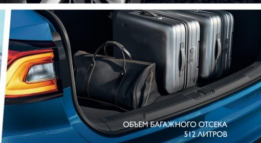
ОБЪЕМ БАГАЖНОГО ОТСЕКА 512 ЛИТРОВ