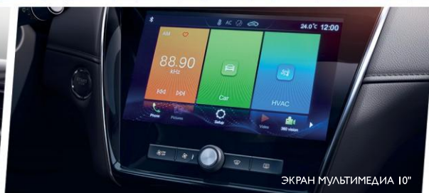
ЭКРАН МУЛЬТИМЕДИА 10"